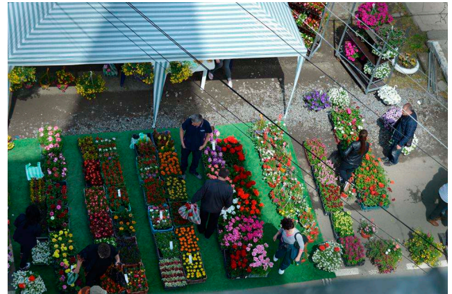
A marosszentannai virágkiállítás felülnézetből