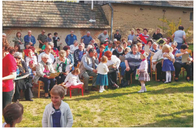
Nagyszülők napja az óvodában