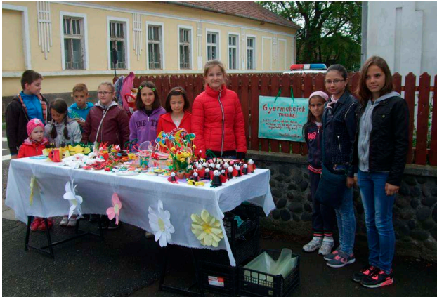
Marosszentannai gyerekek saját készítésű ajándékaikkal