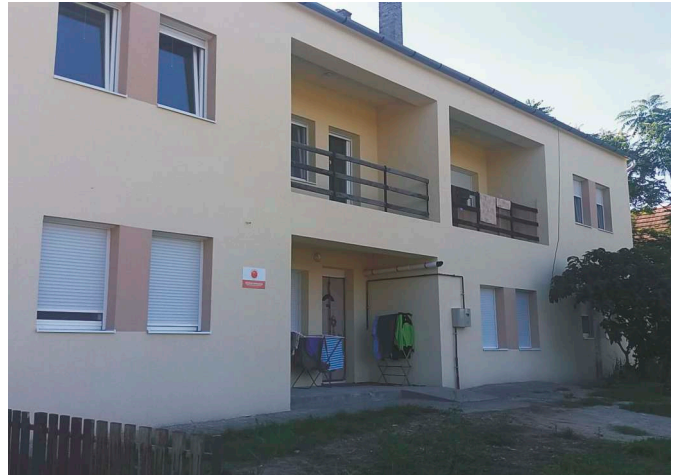
Az orvosi rendelőből kialakított lakások