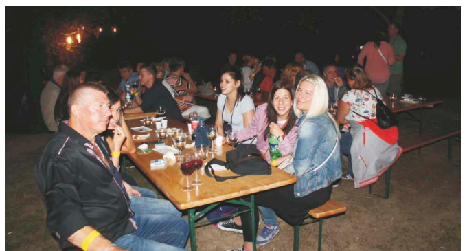
A ZeGaBo vidám résztvevői