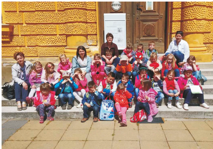
Az óvodások kirándulása Szekszárdon