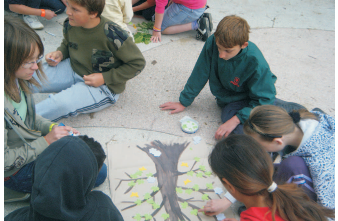
A Föld Napja