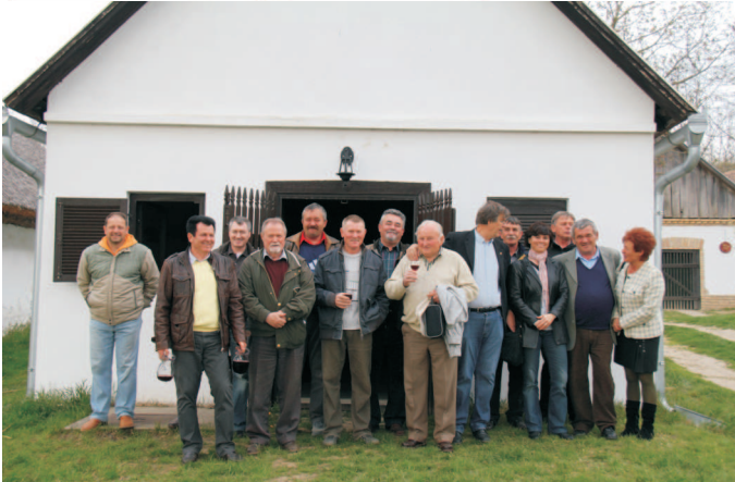
Borbírák és vendéglátók